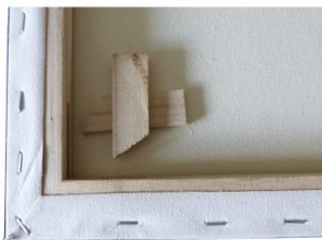
Keilrahmen und Keile