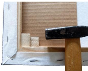
Zum Schutz Pappe unter die Keile legen und Keile vorsichtig in den Keilrahmen treiben